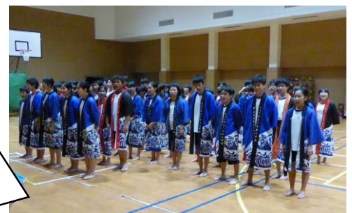
中学部全生徒による「よきこいソーラン」